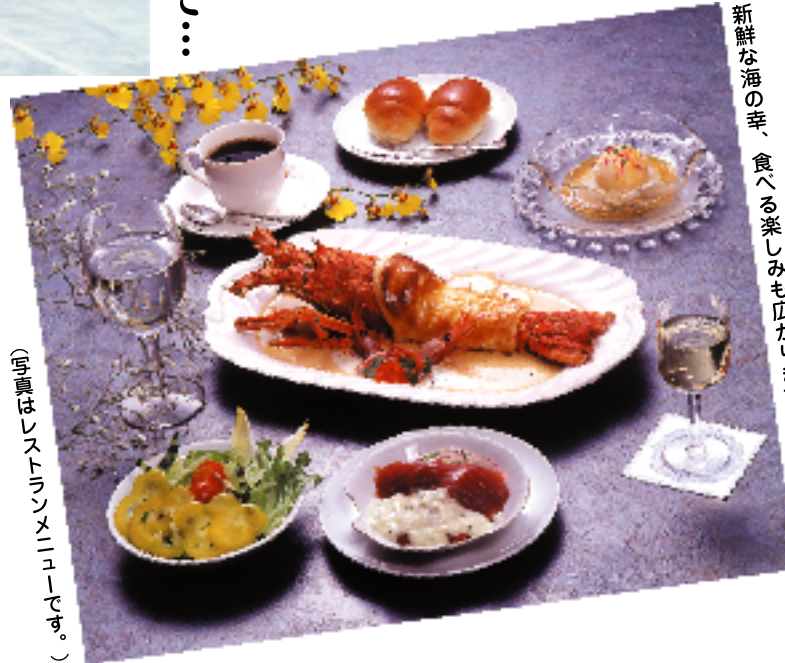
(写真はレストランメニューです。)

露天風呂の貸切りもできます。 カップルでも、お子さまと一緒に 安心！温泉情緒を満喫ください。 湯上がりには四季折々の自慢の 南欧料理がおたのしみ頂けます。 グルメと温泉と観光スポットも有。