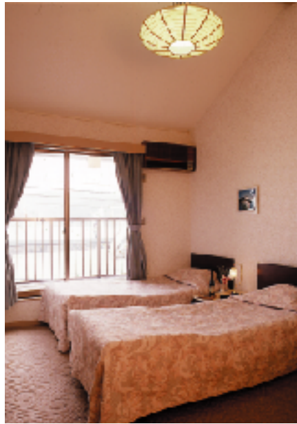
シンプルで清潔なゲストルーム