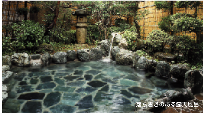
落ち着いた雰囲気のある露天風呂