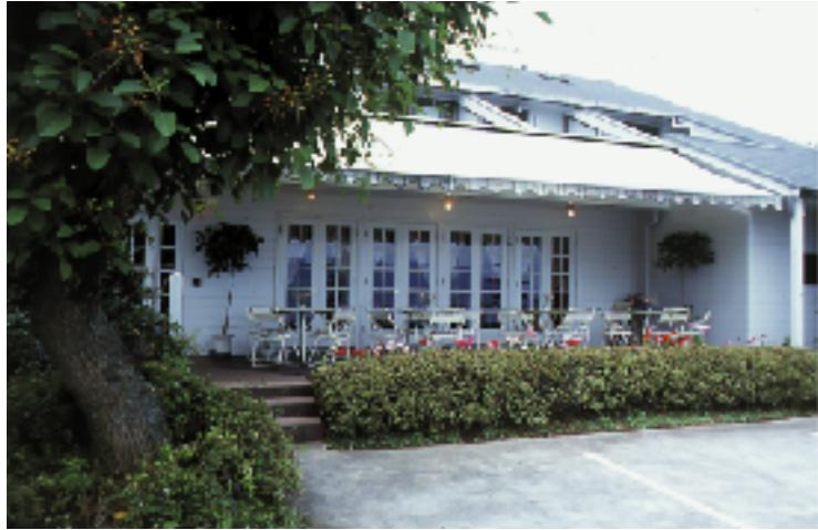
レストラン&ペンション アフターデイズ